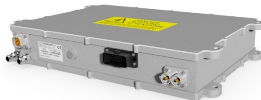
Caricabatteria di bordo della serie HPC di EDN

MTA S.p.A. è un'azienda leader a livello globale per lo sviluppo e la produzione di un'ampia gamma di prodotti elettromeccanici ed elettronici sviluppati al suo interno e destinati ai principali costruttori di auto, moto, trattori e mezzi pesanti. Fondata nel 1954, MTA ha 2 siti produttivi in Italia (Codogno e Rolo), 8 sedi estere, un fatturato di 187 Milioni € e 1.640 dipendenti.