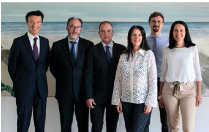
La famiglia Falchetti

R ealizzare, attraverso il ciclo completo che va dalla progettazione alla produzione, componenti elettrici ed elettronici per il settore automotive, offrendo la propria competenza e collaborazione ai clienti che cercano un partner affidabile e flessibile: